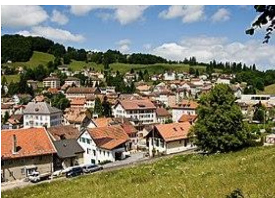
Village de la SAINTE-CROIX

Deux ans après à Rouen, une inculpation pour meurtre provoque des ulcères ; Angèle empoisonne Baptiste son ex bien aimé avec de la mort aux rats.